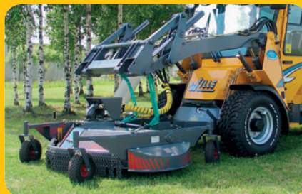
Klippare i horisontellt läge